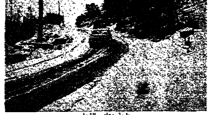
طريق معاصر الشلوح